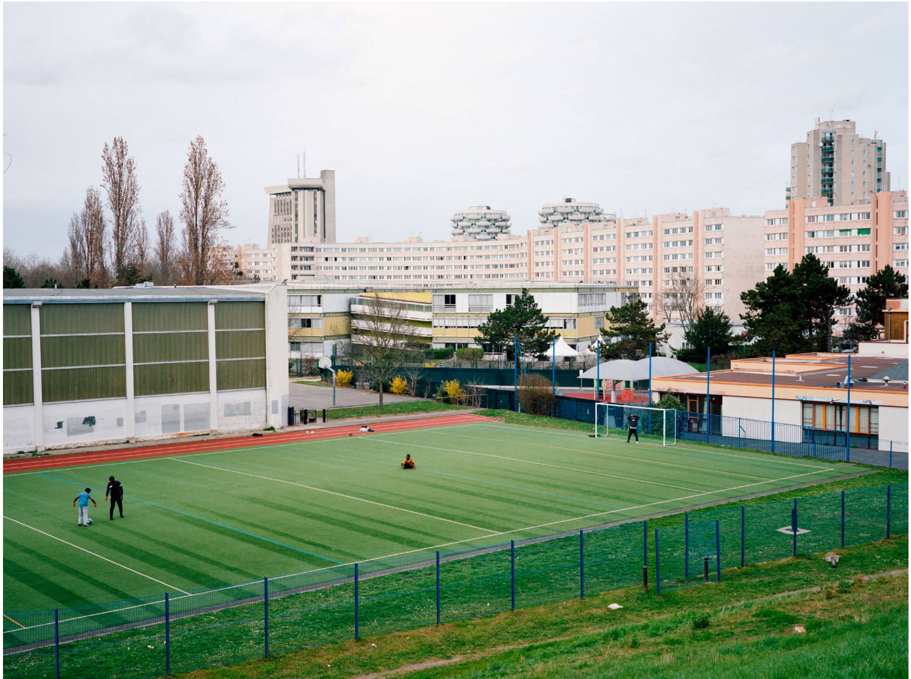
Créteil, photographie issue de la série Quatre Vingt Six