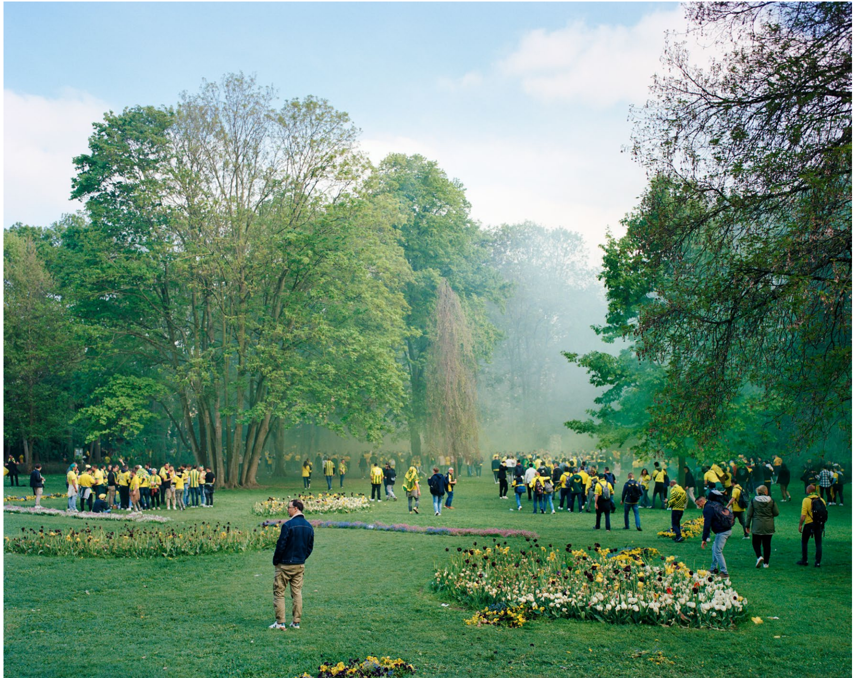
Supporters du FC Nantes dans le Parc de la Légion d'Honneur, Saint-Denis, 2023