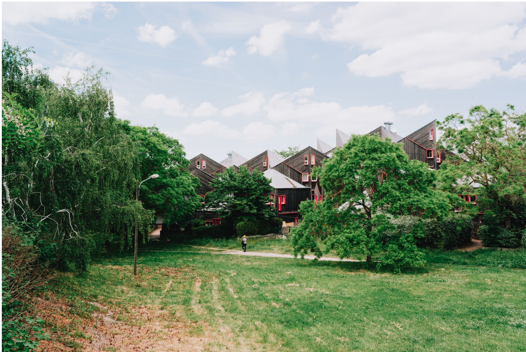
Cité Pierre Sépard, Le Blanc Mesnil, architecte Iwona Buczkowska, photographée pour The Architectural Review