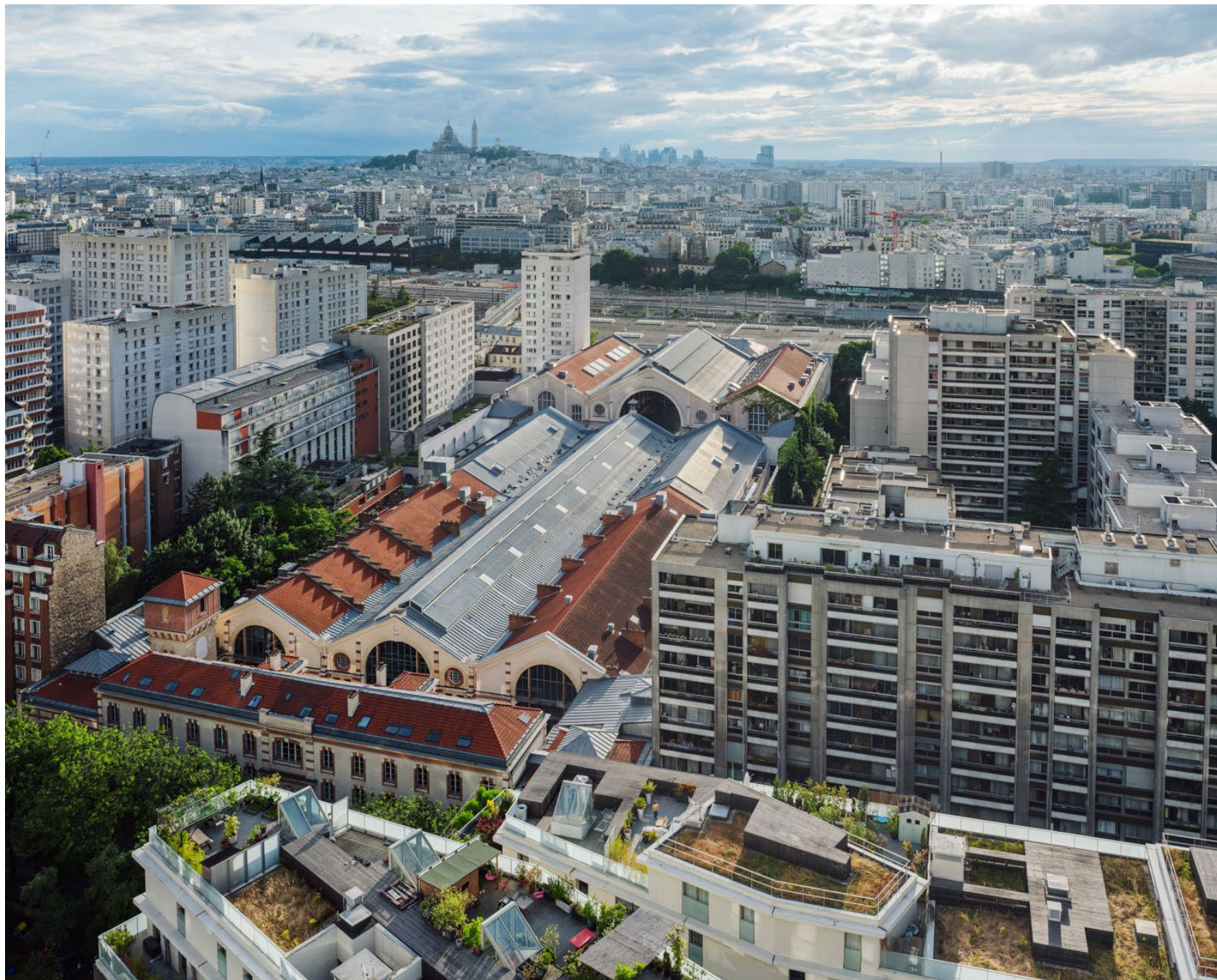
Le Centquatre, rénovation Atelier Novembre, photographié pour The Architectural Review