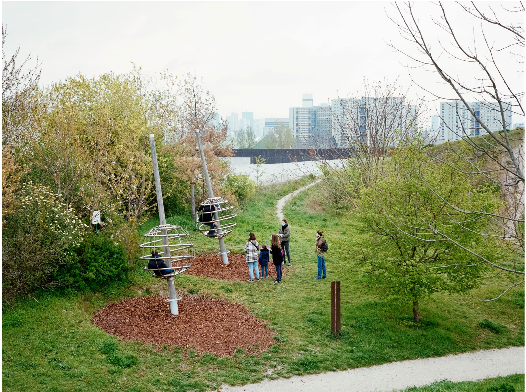
Parc du Chemin de l'Île à Nanterre, photographie issue de la série Quatre Vingt Six