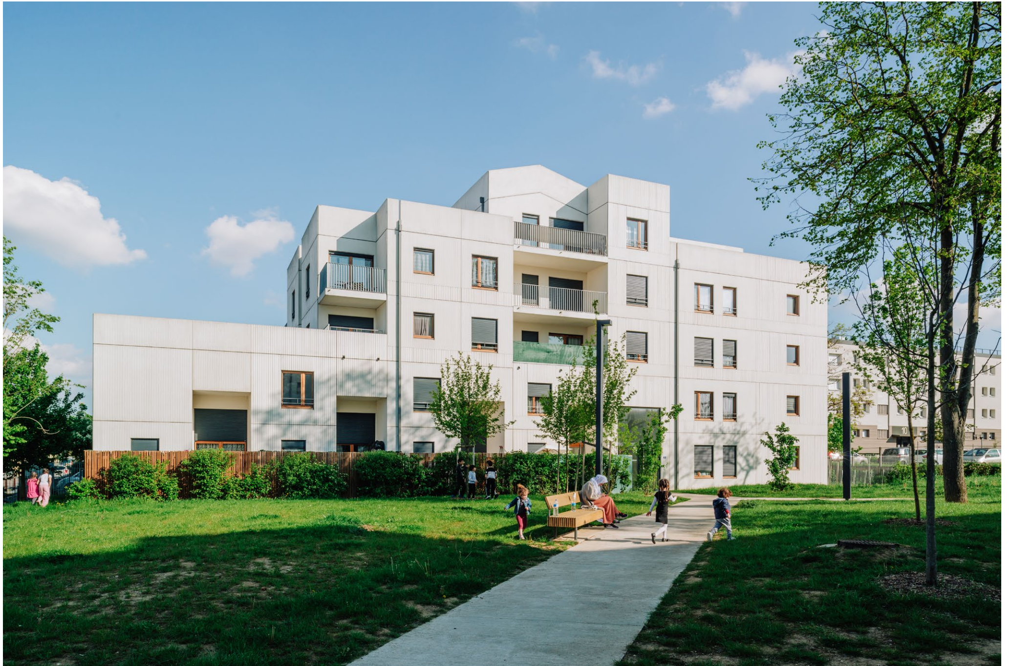
Logements Progrès, Morsang-sur-Orge, ANMA