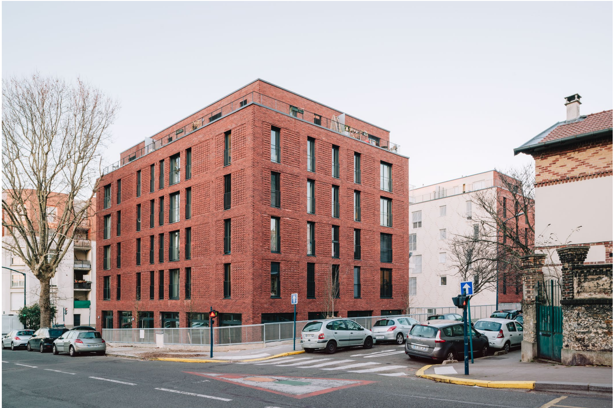
Logements, Pantin, atelier FUSO