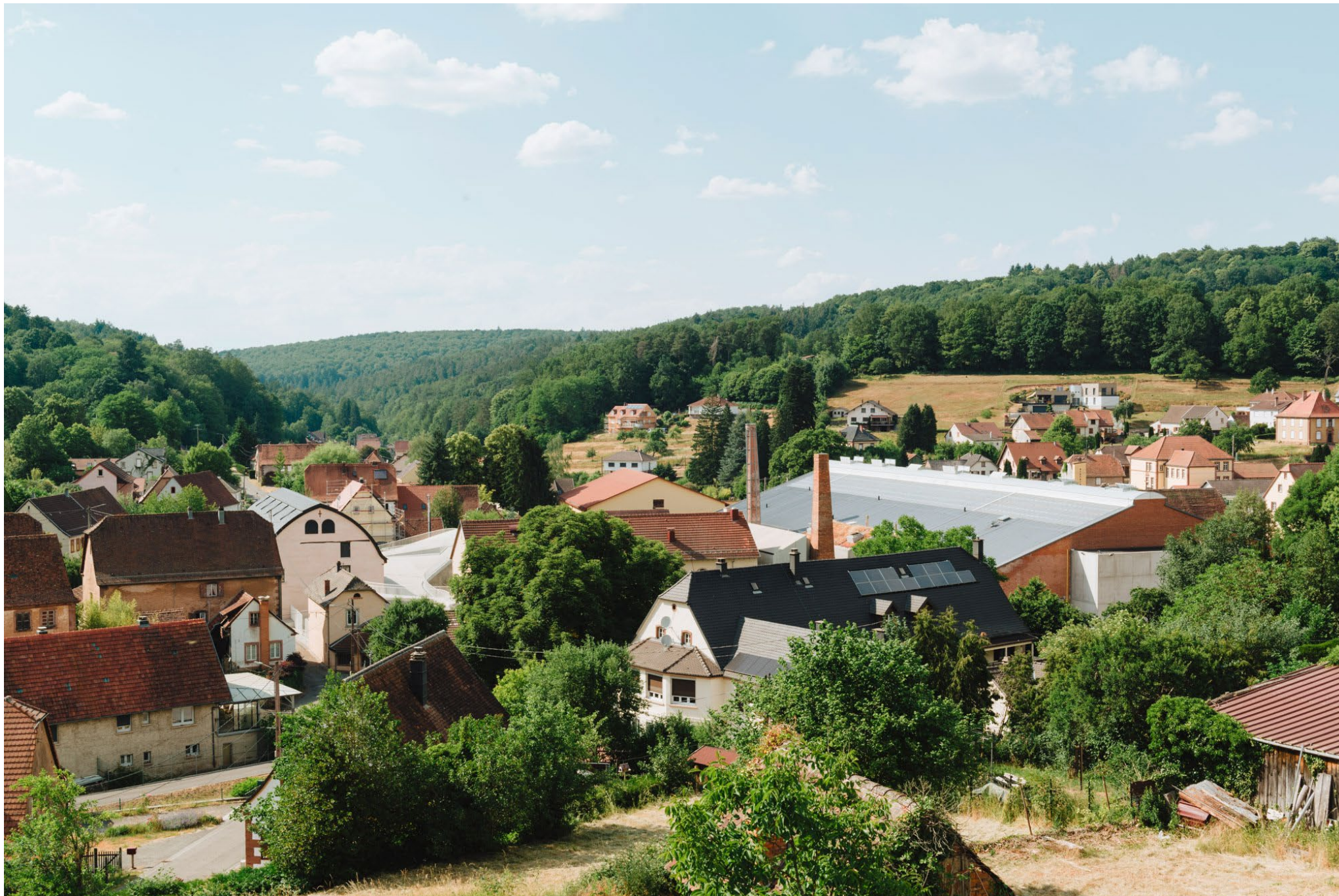
Site Verrier, Meisenthal, rénovation et transformation SO-IL et FREAKS architecture, photographié pour The Architectural Review