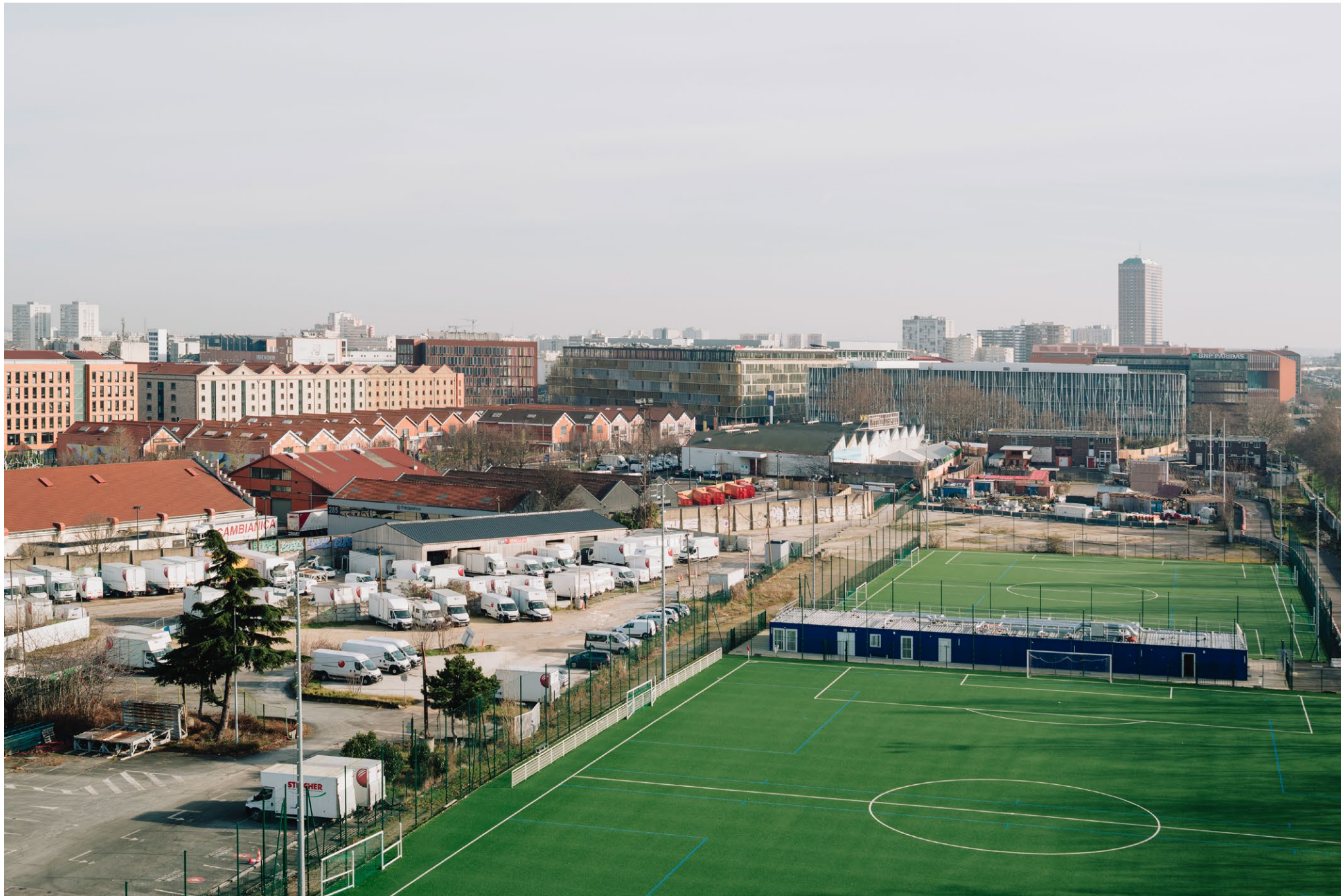
Reportage sur la ZAC Gare des Mines - Fillettes, Paris