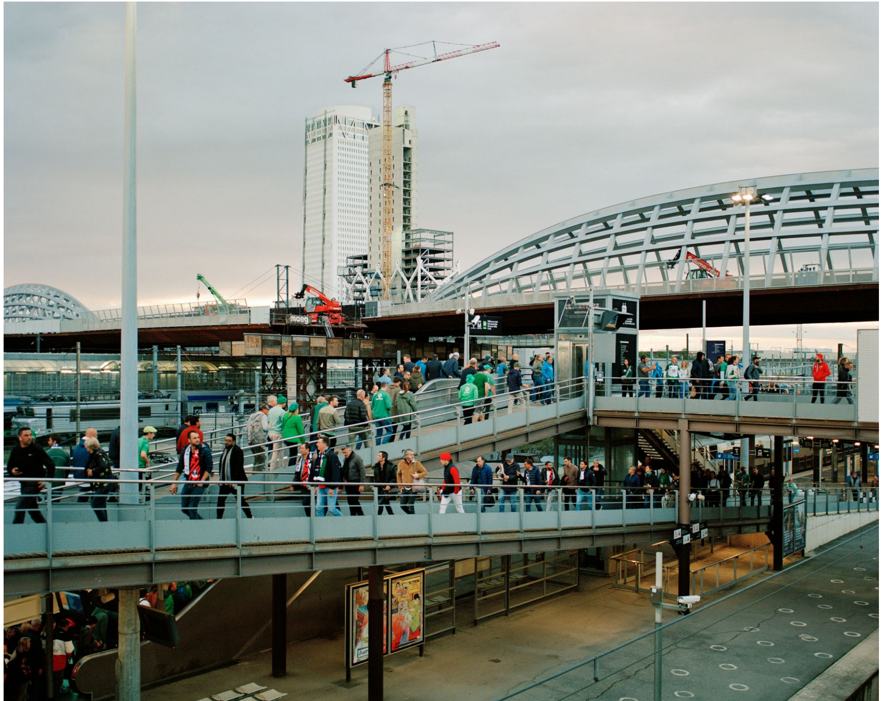
Supporters de rugby à la gare RER D Stade de France Saint-Denis avant Irlande-Nouvelle-Zélande, 2023