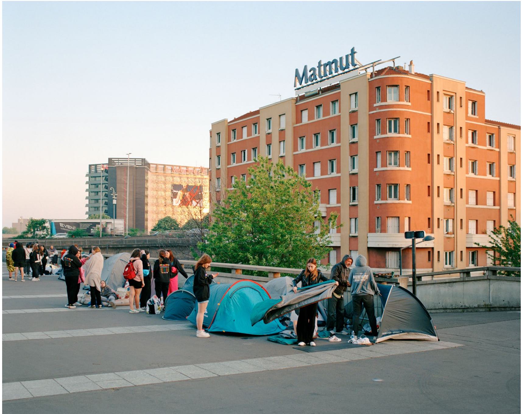
Fans de Harry Styles au matin du concert au Stade de France, 2023