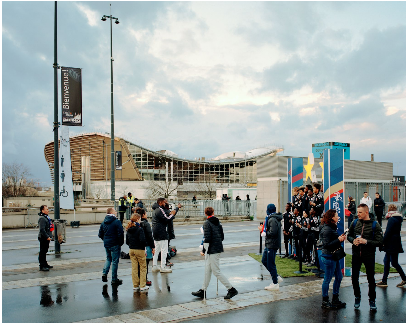
Parvis du Stade de France et chantier du Centre Aquatique Olympique, «Une Saison au Stade», commande de la ville de Saint-Denis sur les publics du Stade de France, 2023