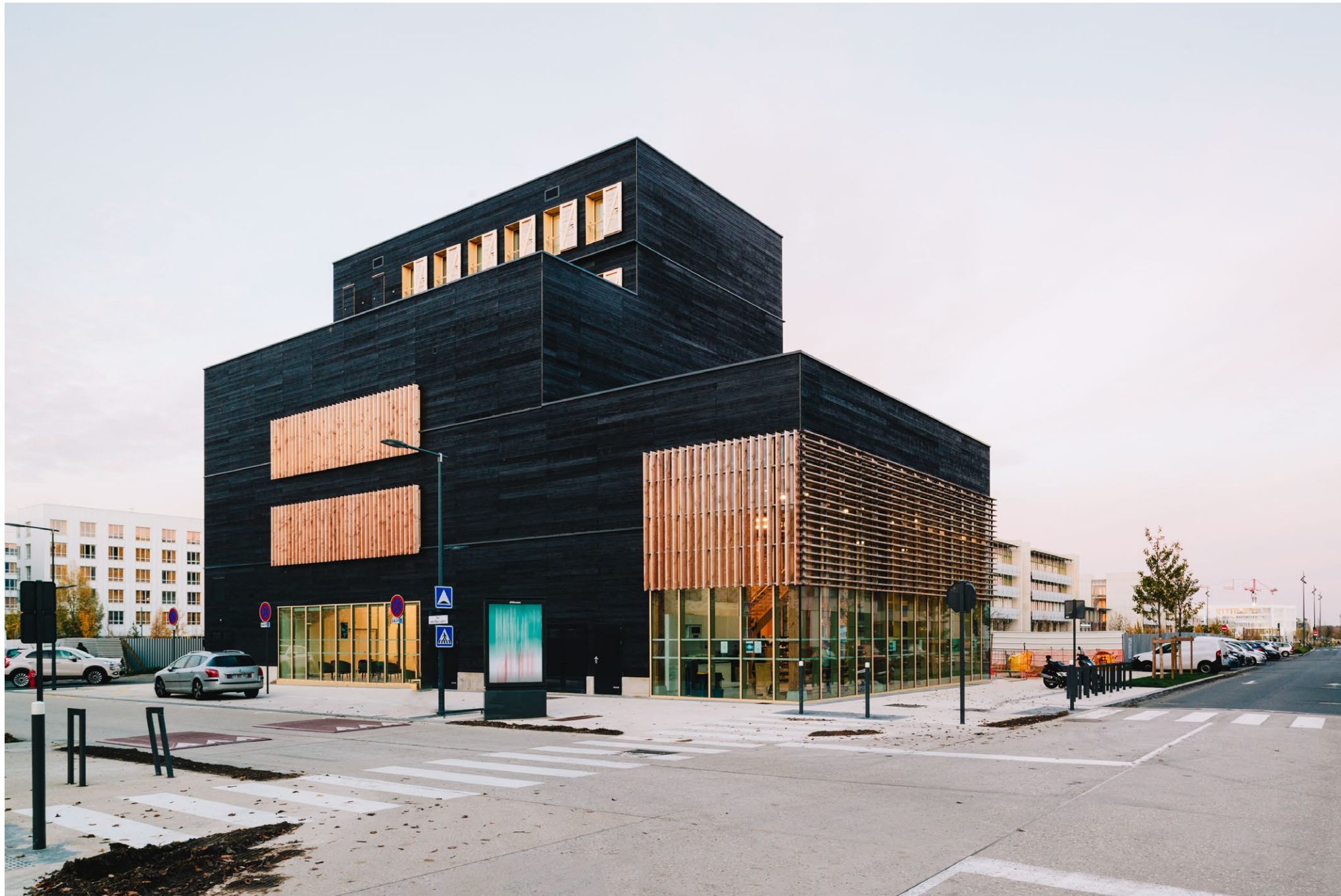
Centre Teilhard de Chardin, Gif-sur-Yvette, agence Duthilleuil