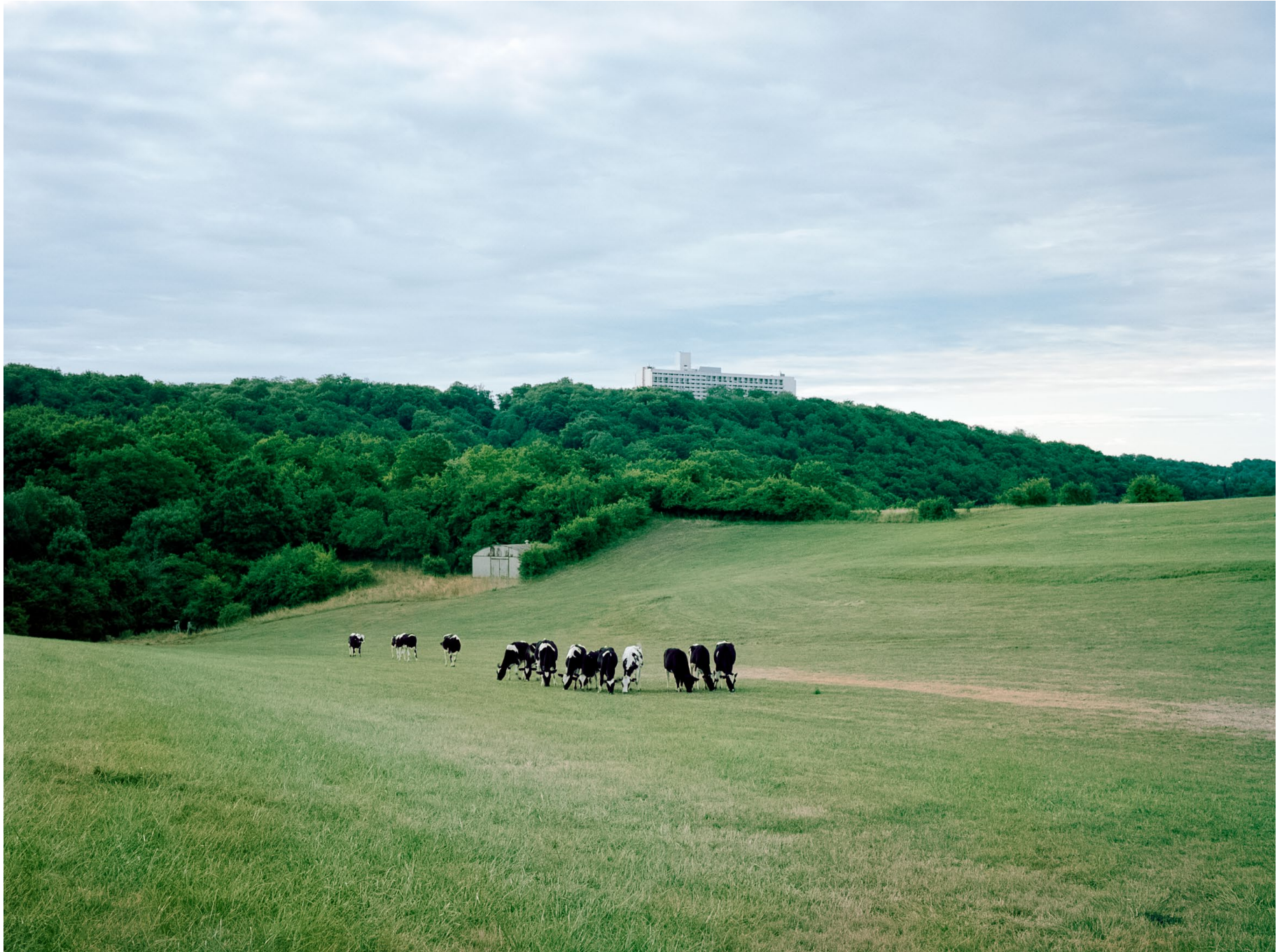
Cité Radieuse de Briey-en-Forêt