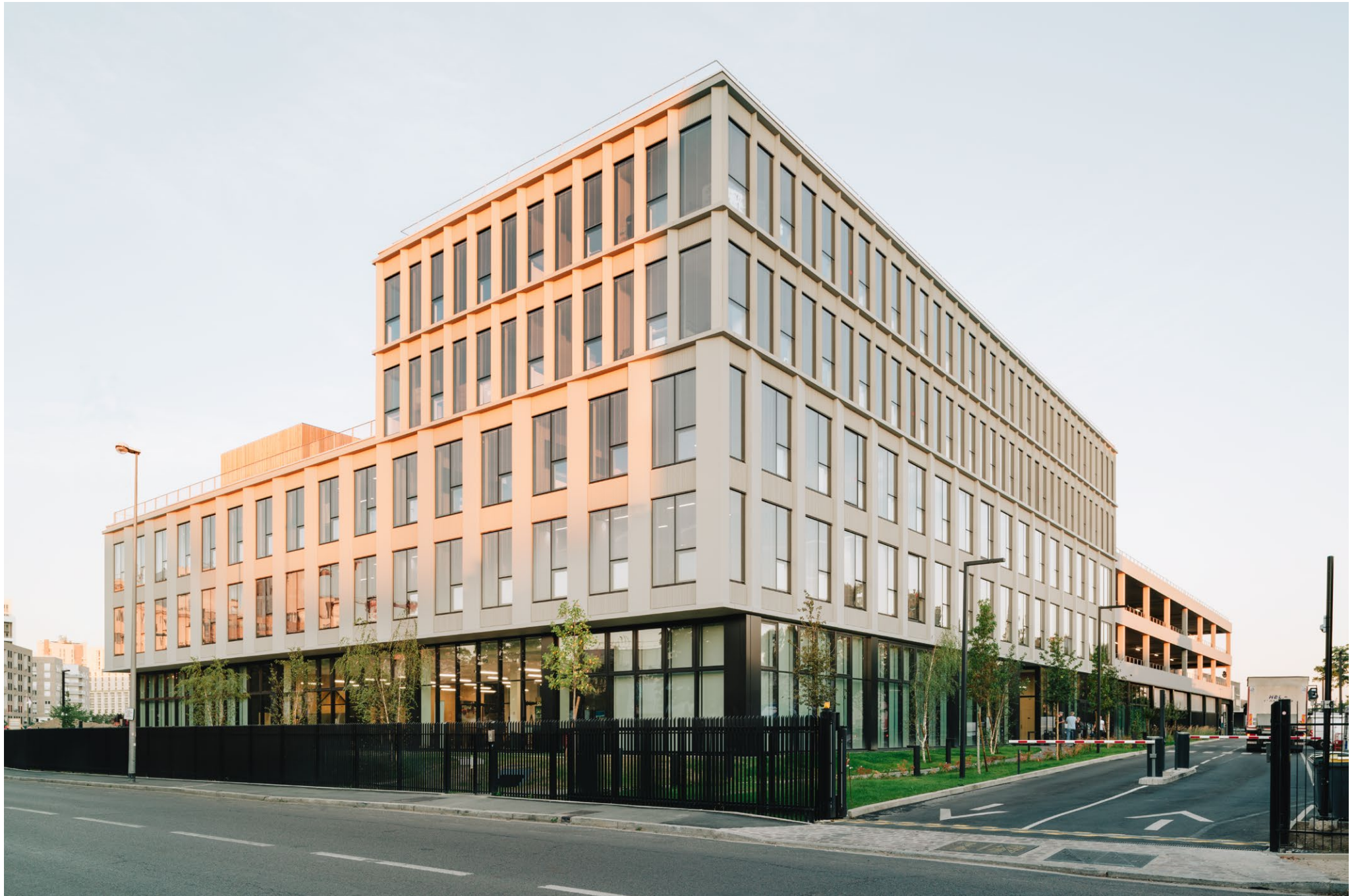
Siège social BALAS, Gennevilliers, atelier FUSO