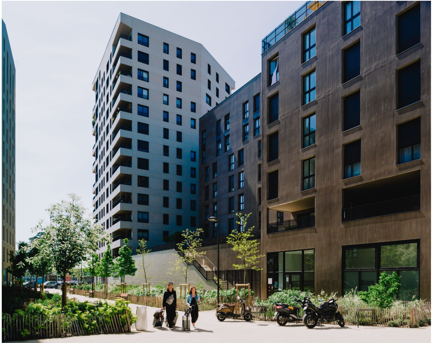
Ilot Le Monde, Ivry-sur-Seine, ANMA