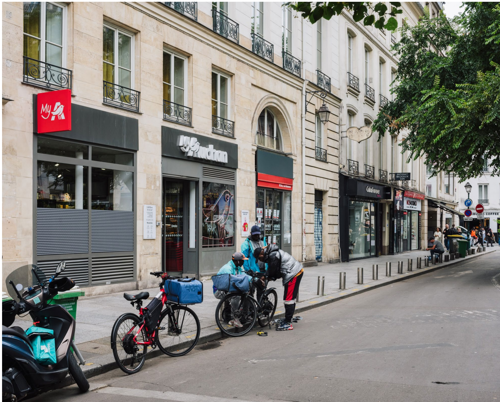
Reportage sur les lieux d'attente des livreurs à vélo à Paris, pour Augure Studio et Faire Paris (Pavillon de l'Arsenal)