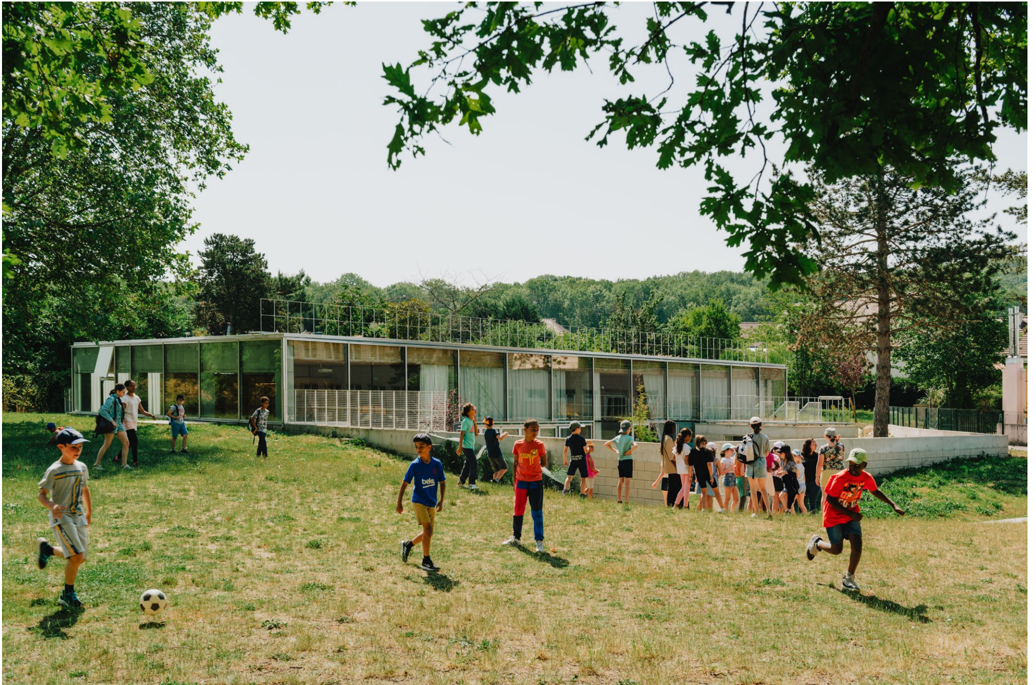
Centre de loisirs, Menucourt, architecte Nicolas Simon