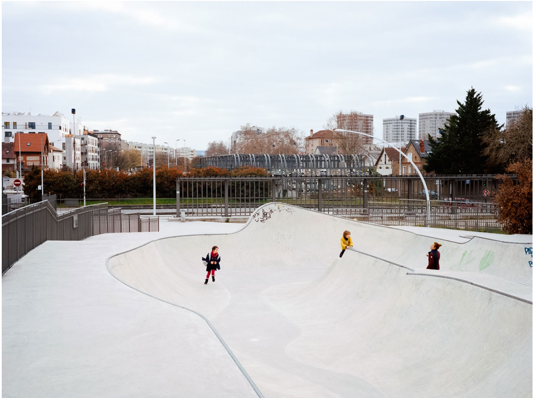
Couverture de l'autoroute A86 à Nanterre, photographie issue de la série Quatre Vingt Six