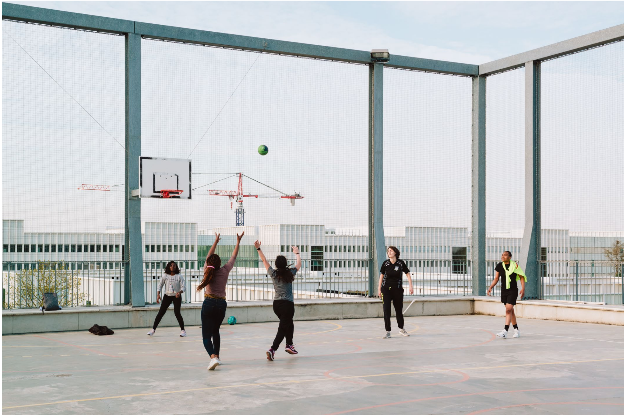
Le Lieu de vie, Gif-sur-Yvette, MUOTO