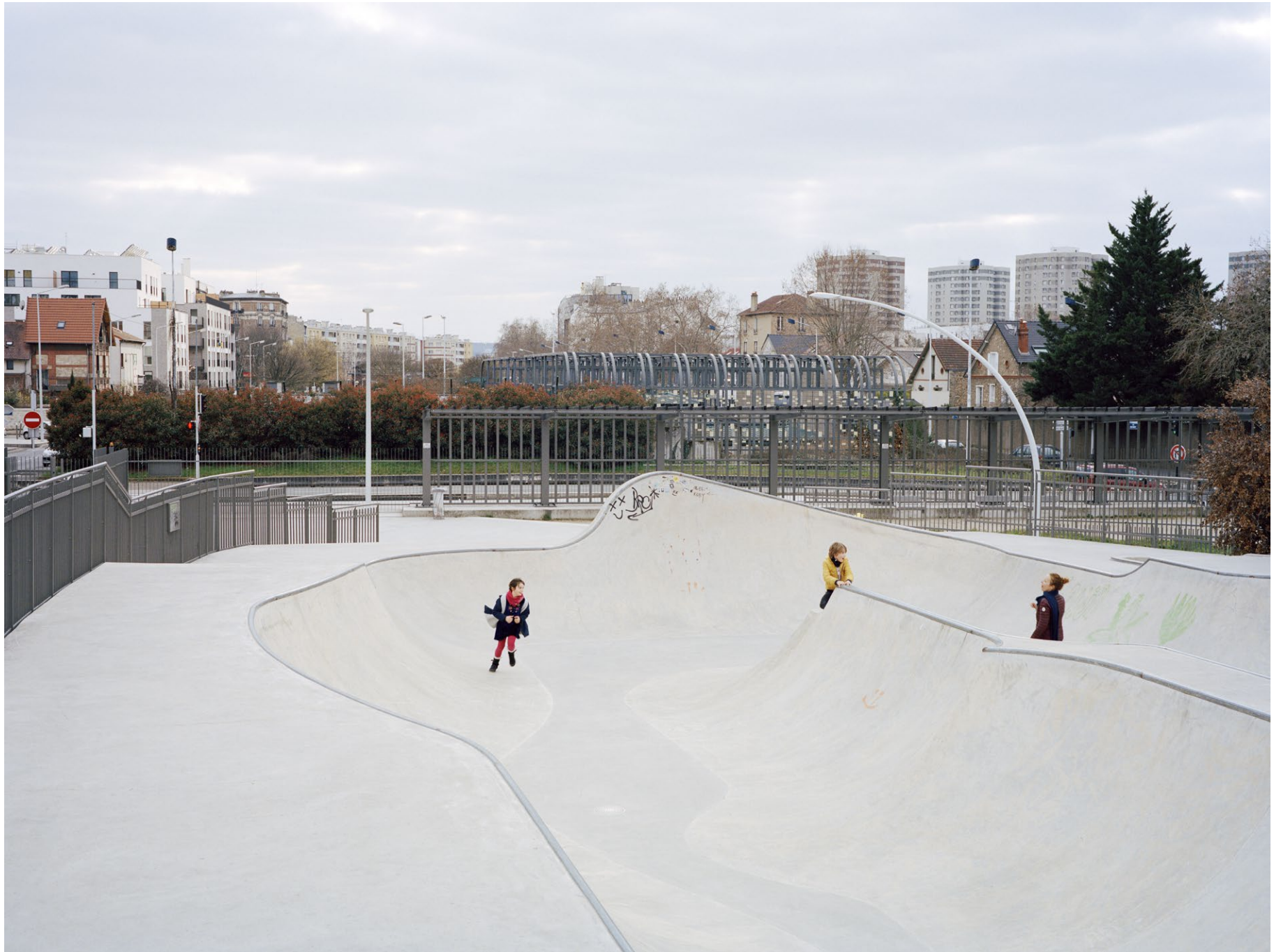
Couverture de l'autoroute A86 à Nanterre, photographie issue de la série Quatre Vingt Six