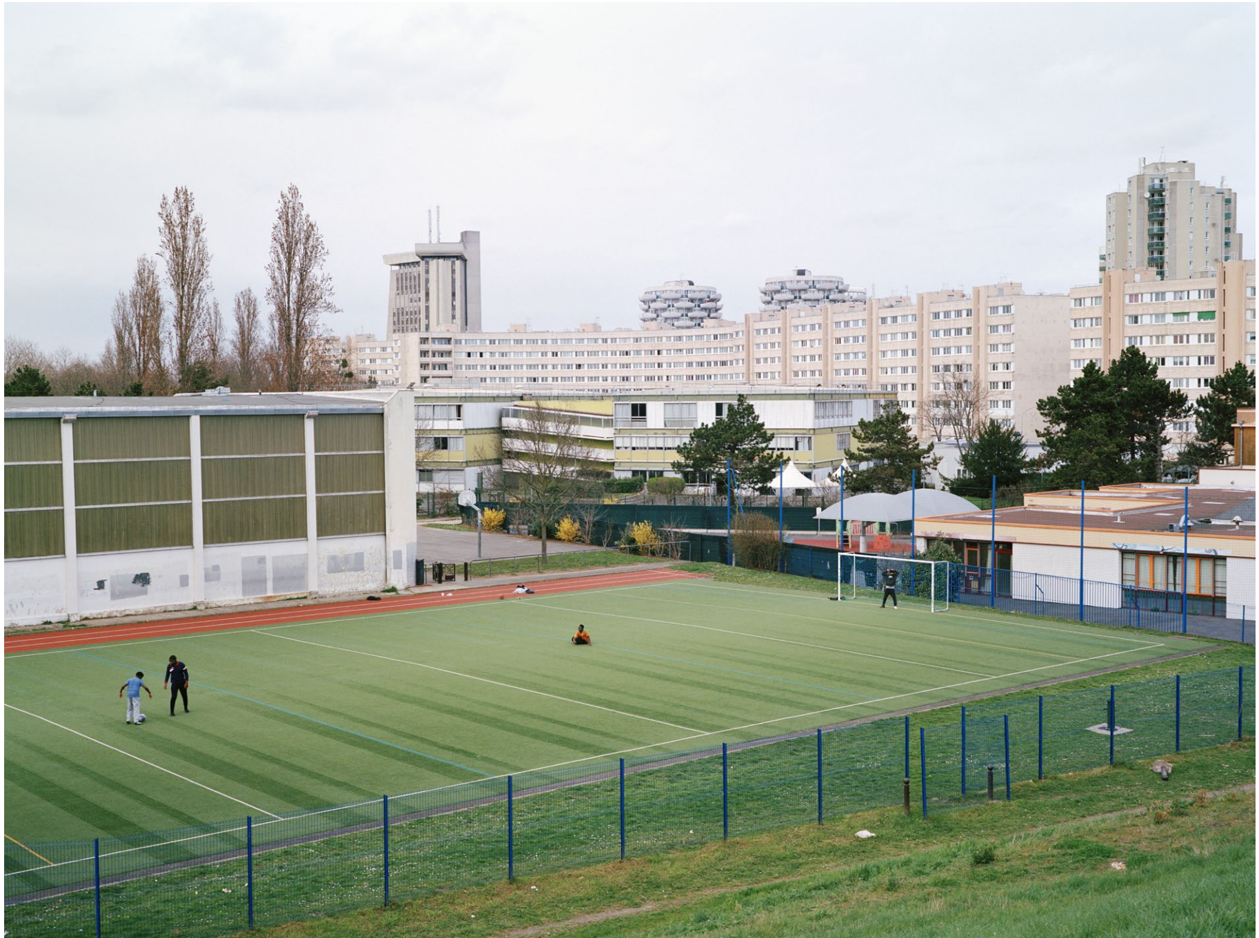
Créteil, photographie issue de la série Quatre Vingt Six