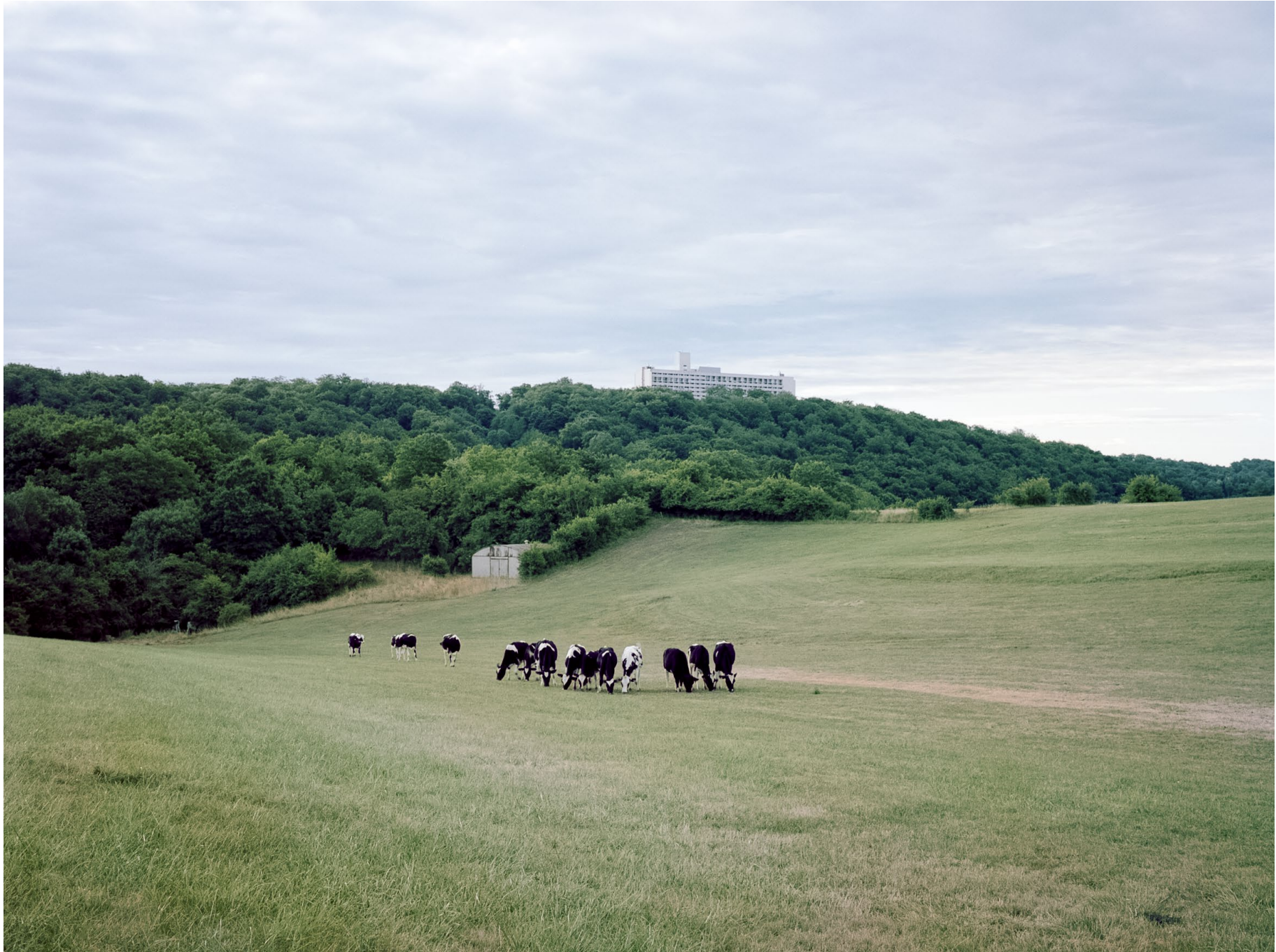
Cité Radieuse de Briey-en-Forêt