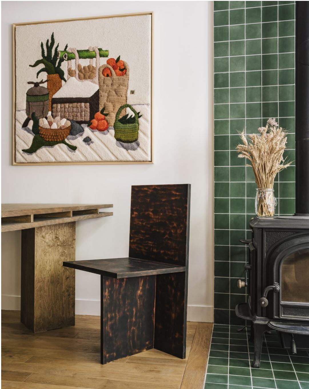
Maison de ville, Paris, Sausset-Léou