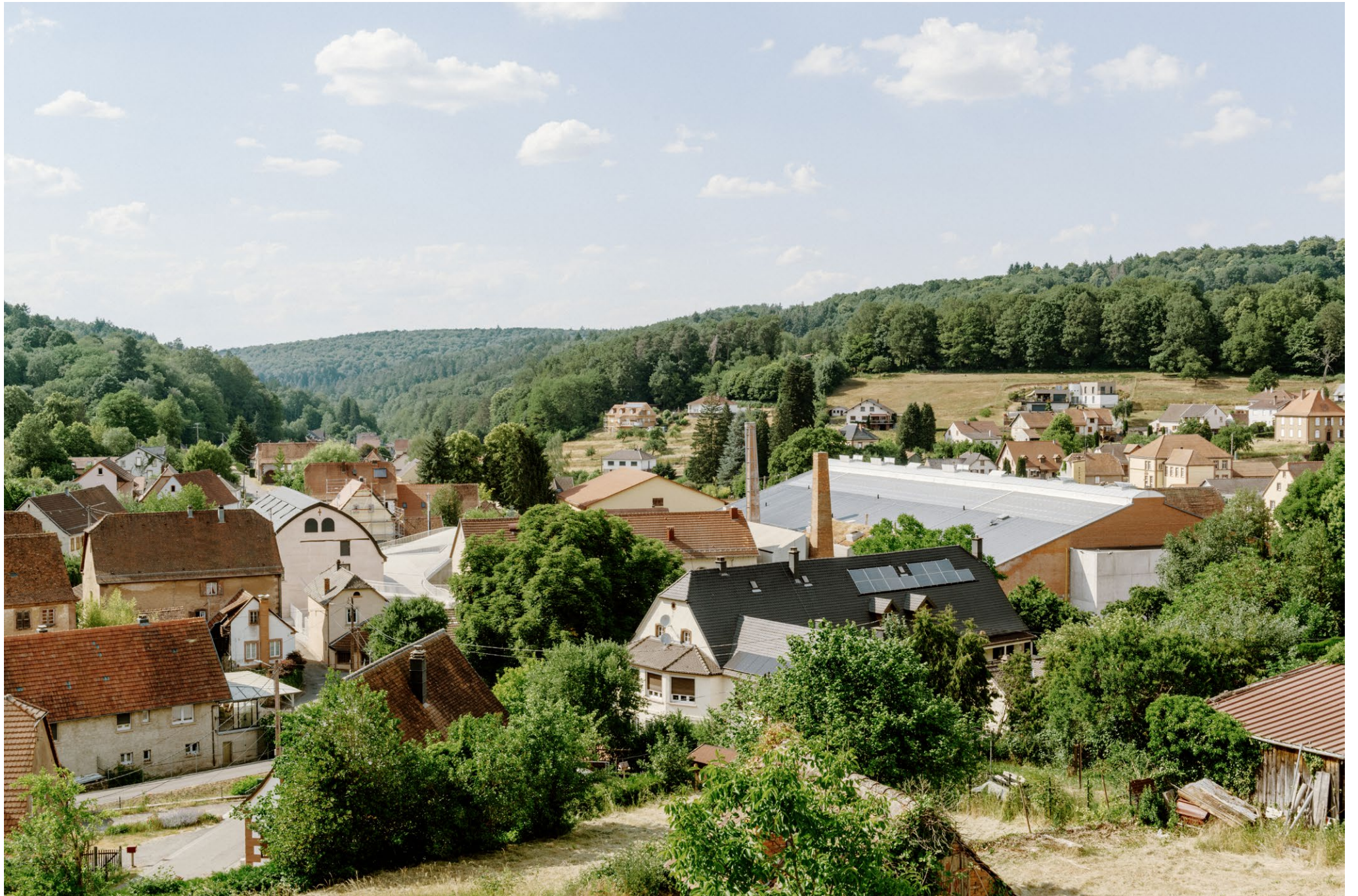
Site Verrier, Meisenthal, rénovation et transformation SO-IL et FREAKS architecture, photographié pour The Architectural Review