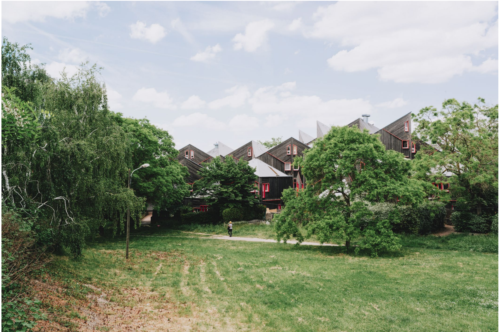
Cité Pierre Sémar, Le Blanc Mesnil, architecte Iwona Buczkowska, photographiée pour The Architectural Review