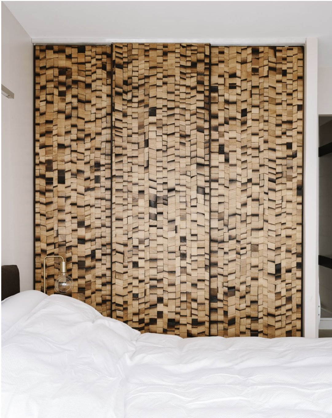
Appartement, Paris, La Remanufacture