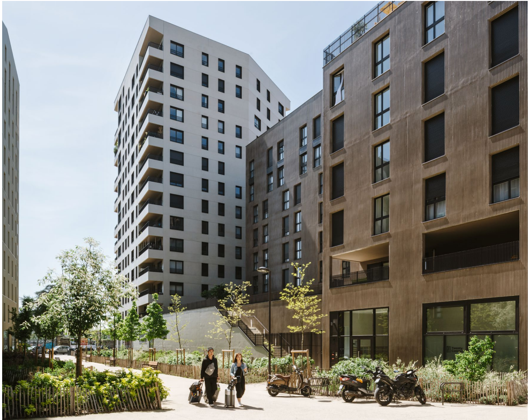
Ilot Le Monde, Ivry-sur-Seine, ANMA