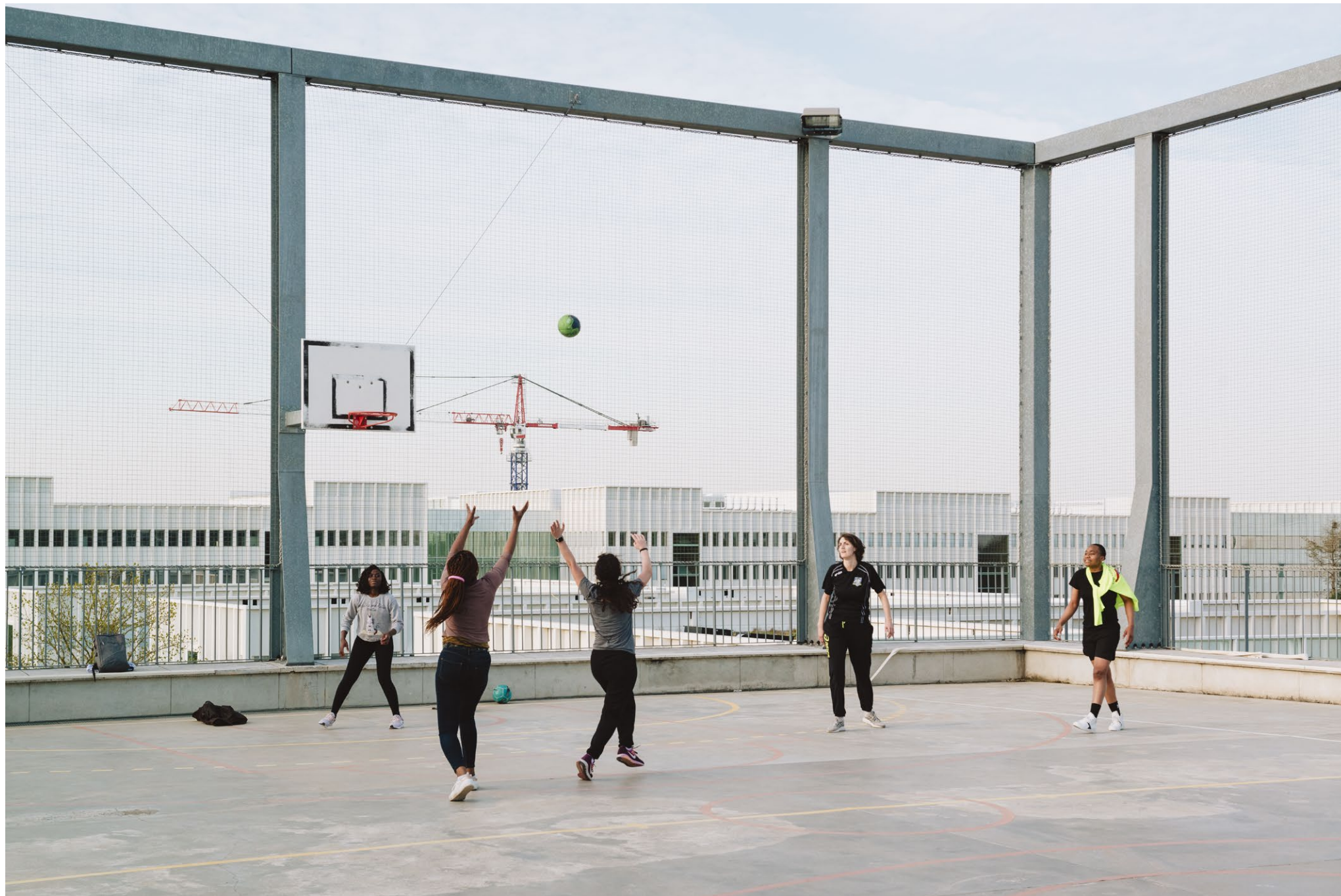
Le Lieu de vie, Gif-sur-Yvette, MUOTO