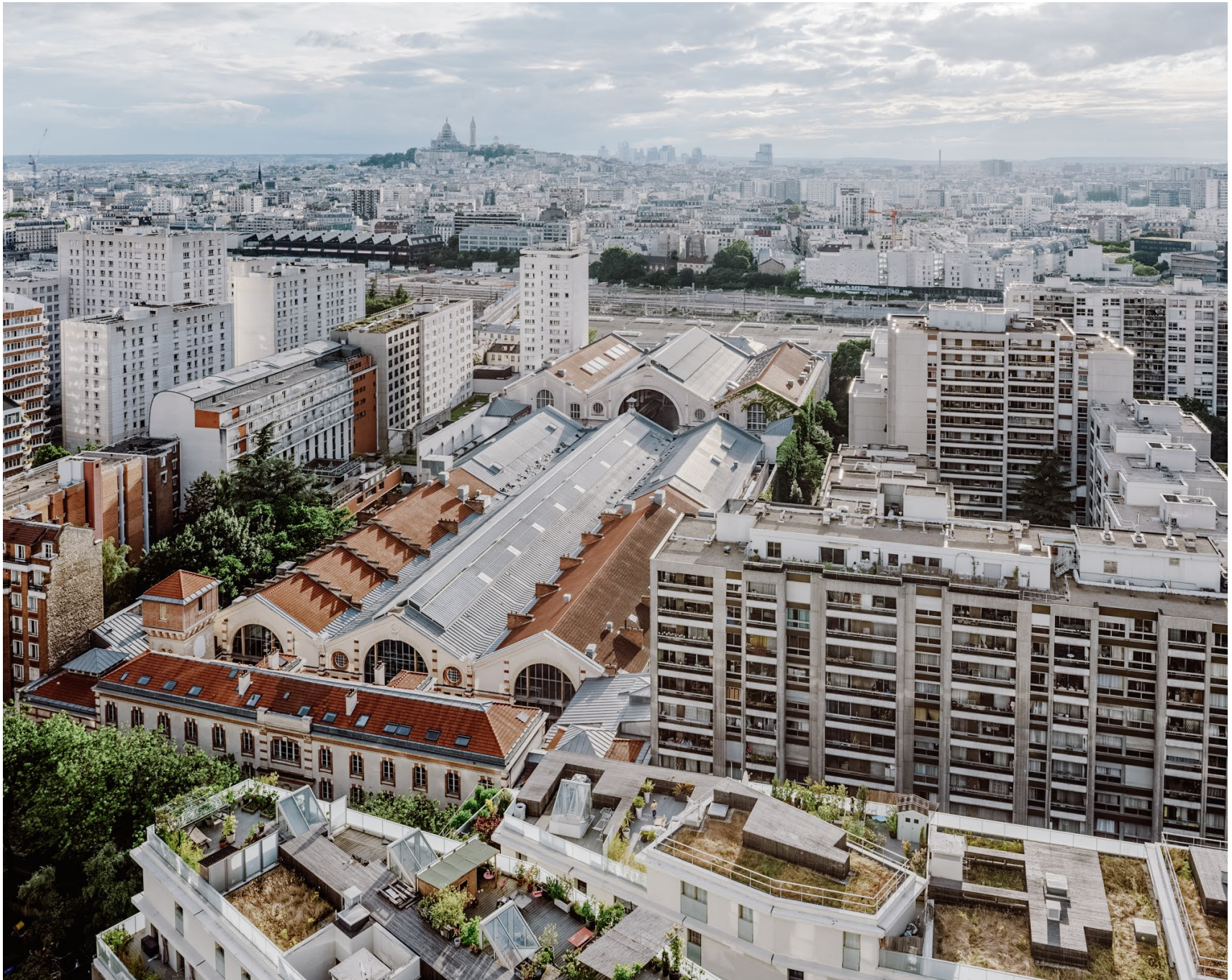
Le Centquatre, Paris, rénovation et transformation Atelier Novembre, photographié pour The Architectural Review