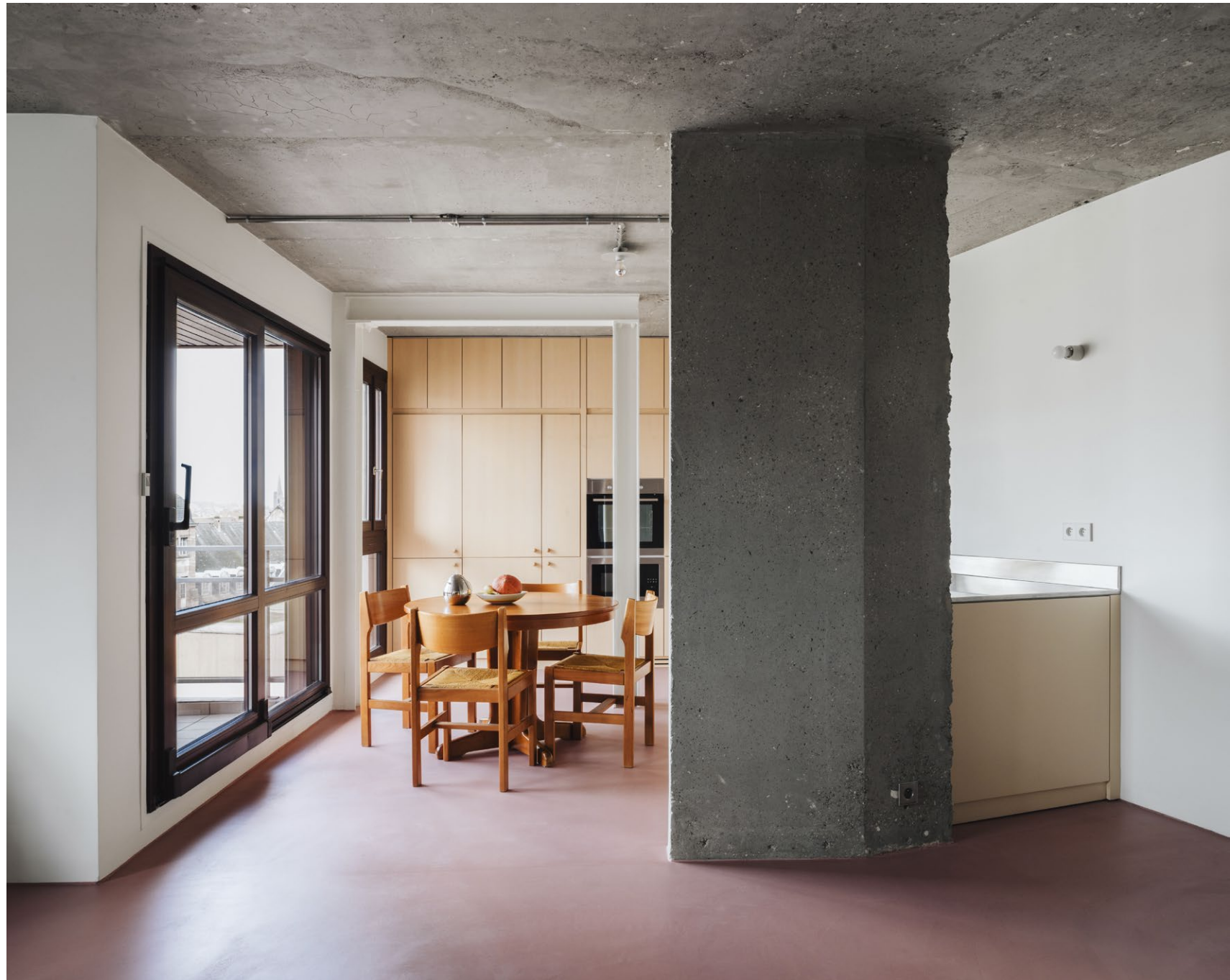
Appartement, Strasbourg, Augure Studio