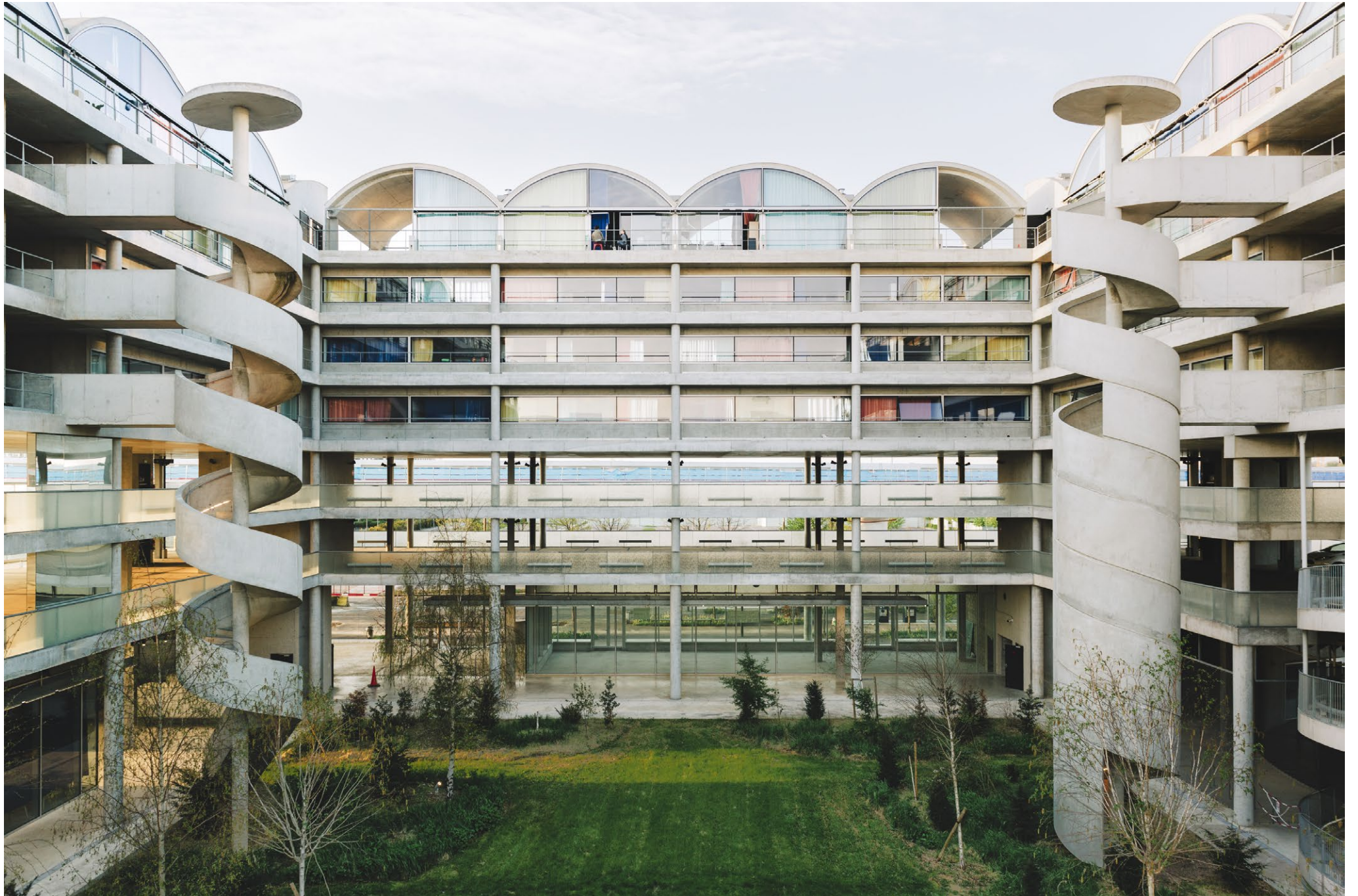
Résidence étudiante et parking réversible, Saclay, Bruther / Baukunst