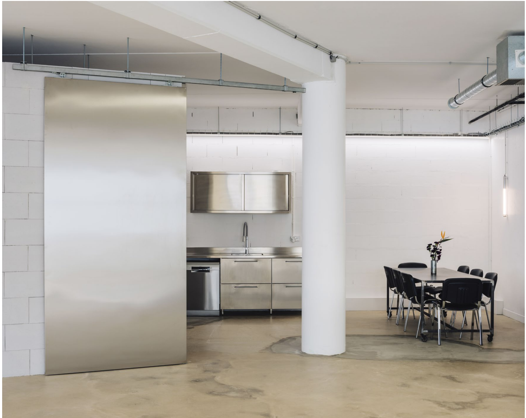
Studio photo, Paris, Augure Studio