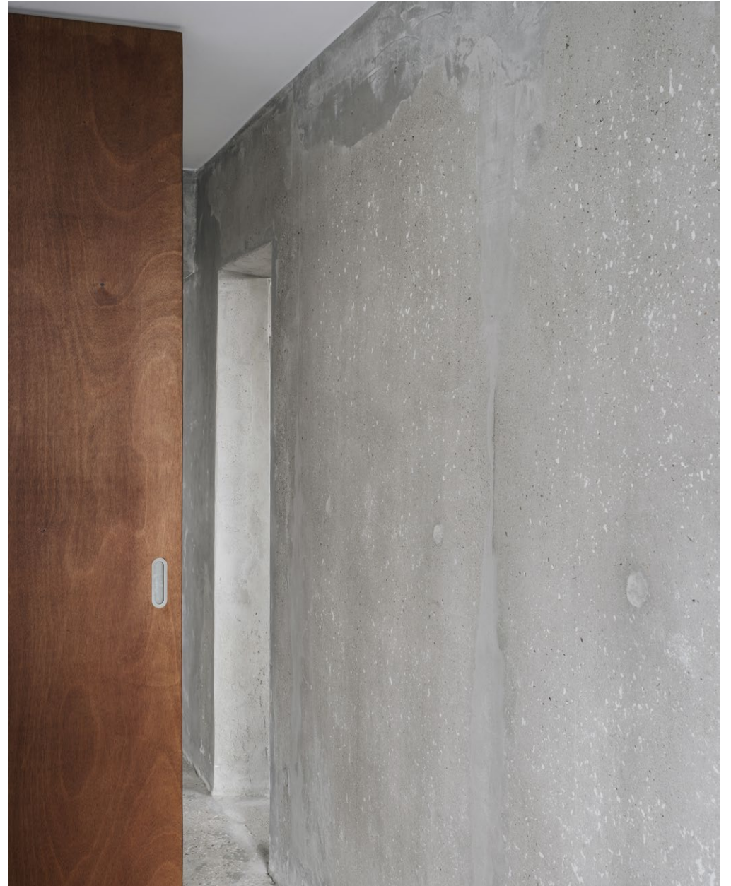
Appartement, Paris, Augure Studio