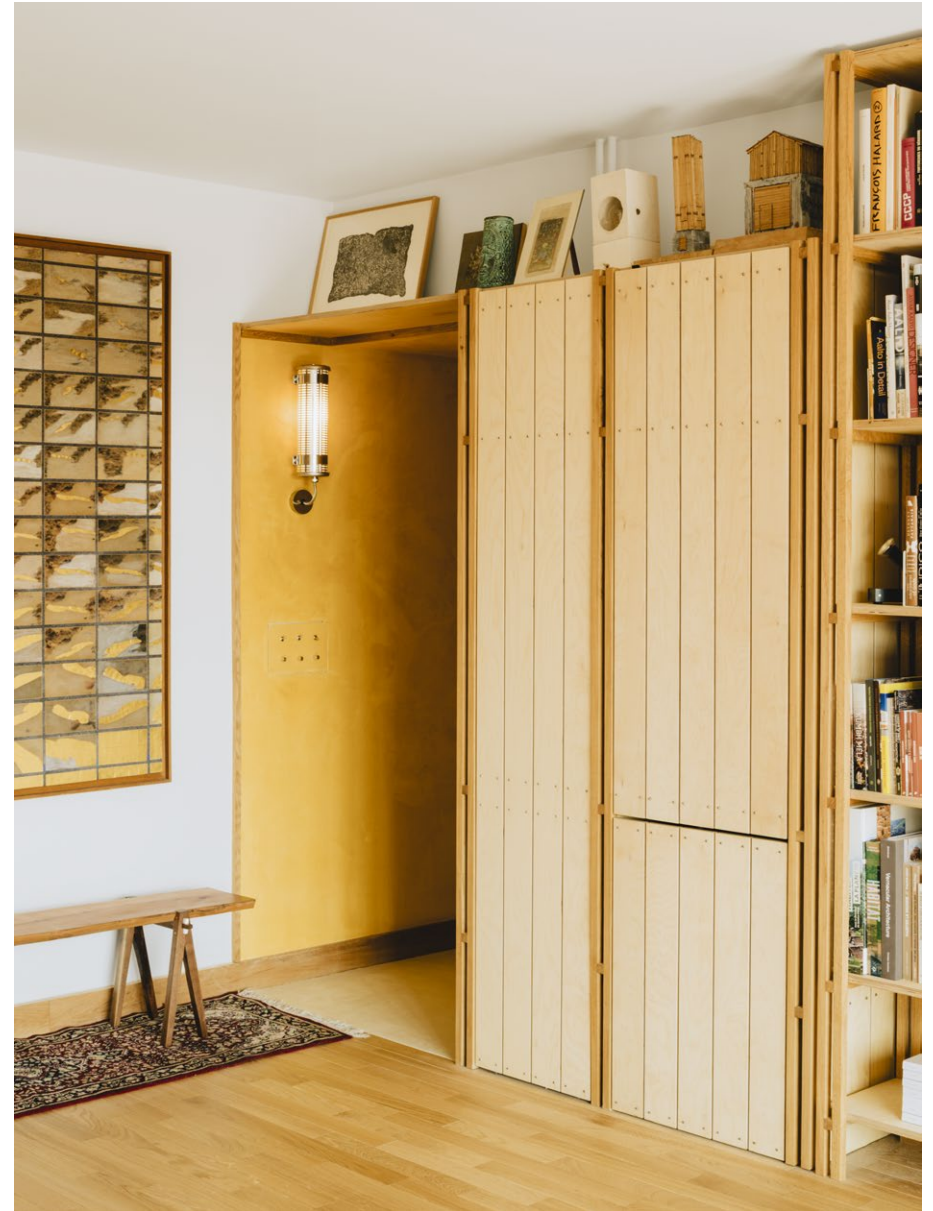
Appartement, Paris, Materra-Matang