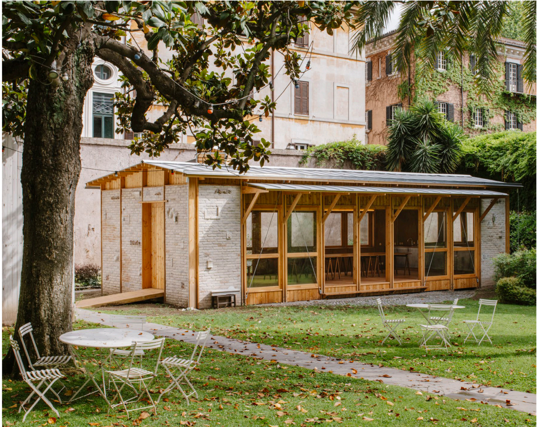
Pavillon bioclimatique, jardin de l'ambassade de France, Rome, Materra-Matang