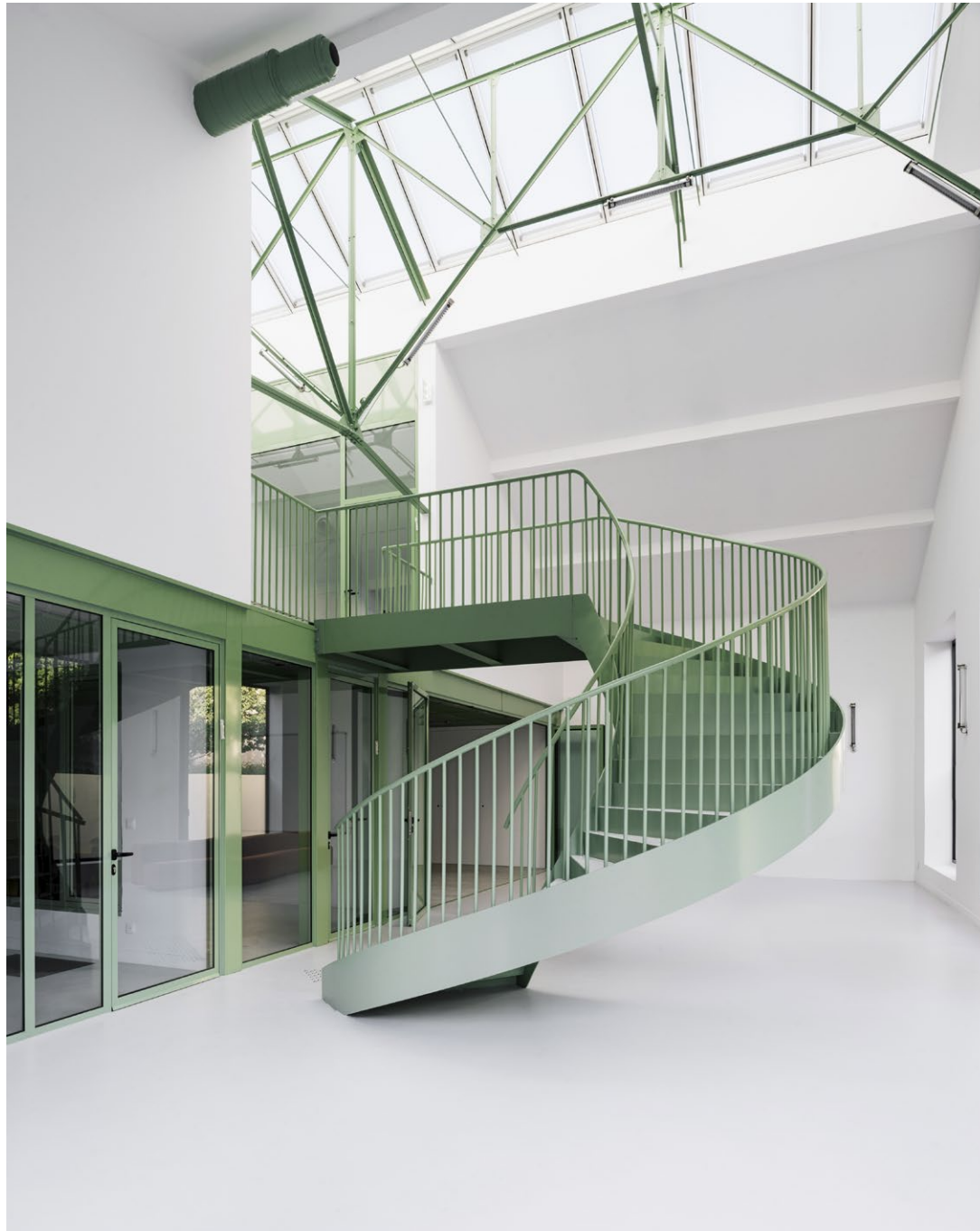
Transformation d'un site industriel, Courbevoie, Studio Belem