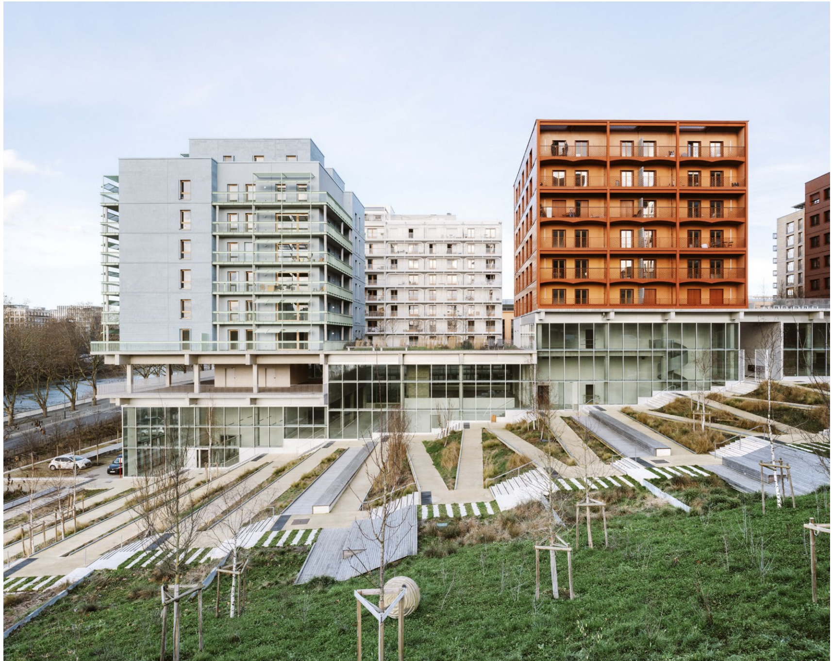
Sport Social Club, Village des Athlètes, Saint-Ouen, uapS